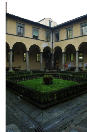
Il chiostro del Buontalenti. ..... Facoltà di Scienze della Formazione

Il linguaggio: Aspetti fenomenologici, esistenziali, analitici